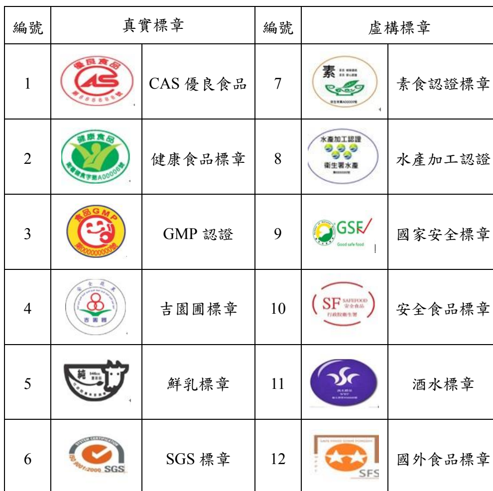
表 3-4 真實與虛構食品安全認證標章

本專題首先依據衛福部網站 ( http://www.mohw.gov.tw/CHT/Ministry/Index.aspx ) 遴選六個常見的食品認證標章，再自行加入六個虛構標章 (見表 3-4)，以衡量受測者對這十二個標章的放心程度。總體而言，真實標章所獲得的放心程度與認識率皆高於虛構標章，最讓受測者感到放心地為健康食品標章，其次分別為鮮乳標章與 CAS 標章，詳細分析結果見表 3-5。